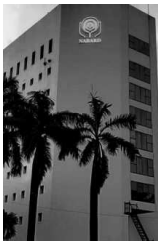
Its balance sheet rose from ₹6.57 trillion as on March 31, 2021, to ₹7.57 trillion as on March 31, 2022

Short-term borrowing declined from ₹2.41 trillion in March 2021 to ₹1.14 trillion in March 2022. But PSL shortfall deposits swelled from ₹99,000 crore in March 2021 to ₹2.52 trillion in March 2022.